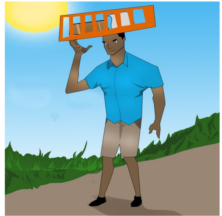
Tom đội cái mâm này trên đầu và đi về nhà.