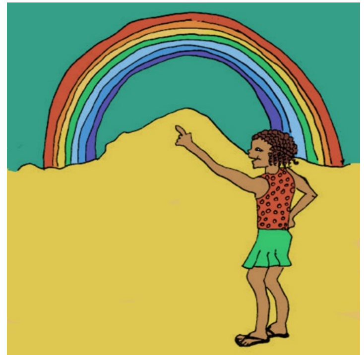
Tôi thấy một cầu vồng.