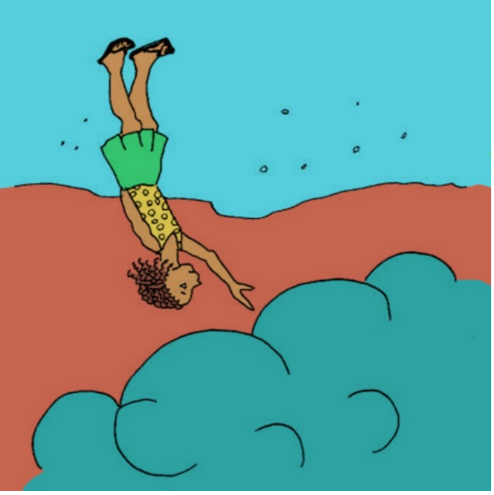
Trời nhiều mây.