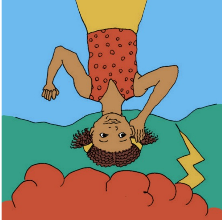
Có sấm sét.