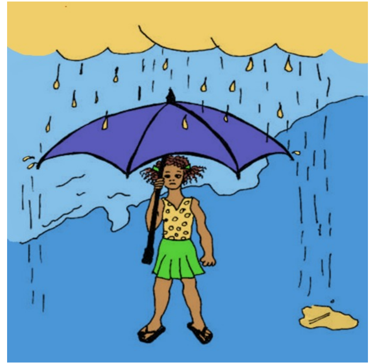
Trời đang mưa.