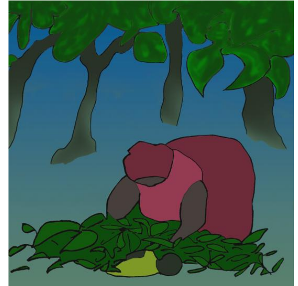
Бабуся заховала Тінгі у купу листя.