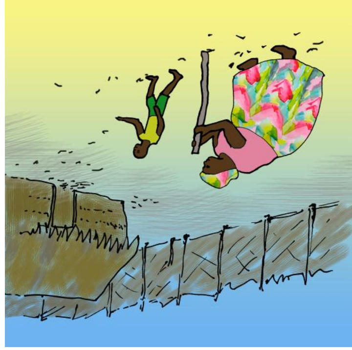
Waxa ay u soo guurguurteen guriga si aad u shanqar yar.