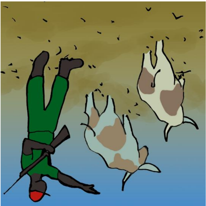
ਠੀਕ ਗੱਲਾਂ ਕੀ ਲੈ ਗਏ।