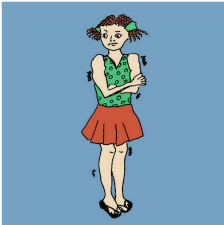
Il fait froid.