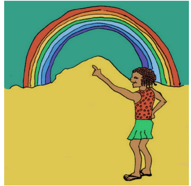
من یک رنگین کمان می بینم.