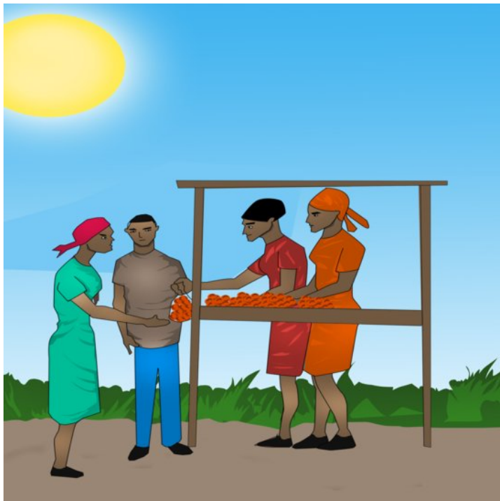
Folk på markedet køber frugt.