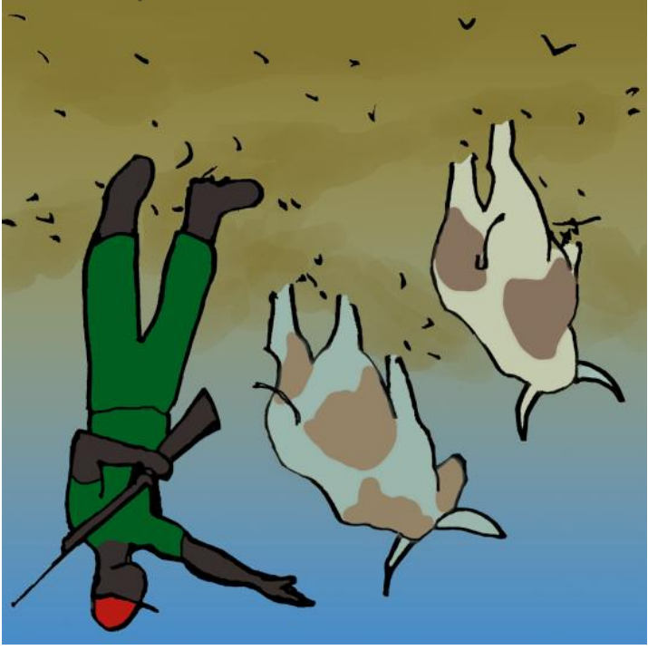
De tog køerne.