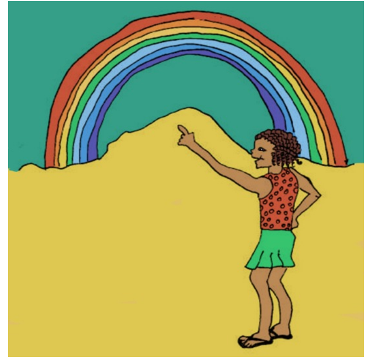
من په لکه زيرپنه يه ك ده بينم.