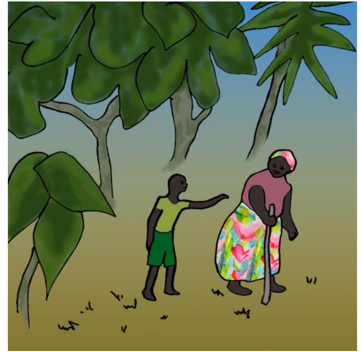
کاتیک بارودۆخه که ئارام بوویه وه، تینگى و داپیرهى هاتنه دهرى.