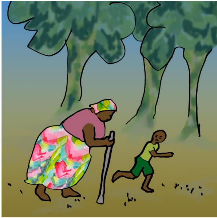
تینگى و داپیرهى ههلاتن و خویان چهشار دا.