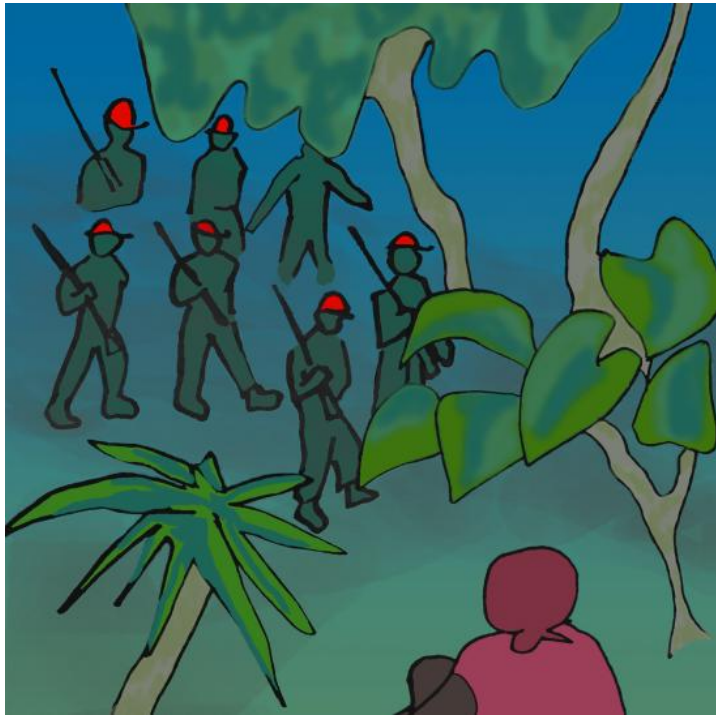
ከዚያ ወታደሮቹ መመለስ ጀመሩ።