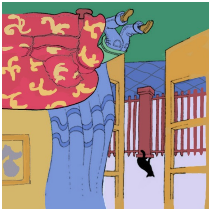
ከቋረጥ ስጋጃ ውጭሃላ