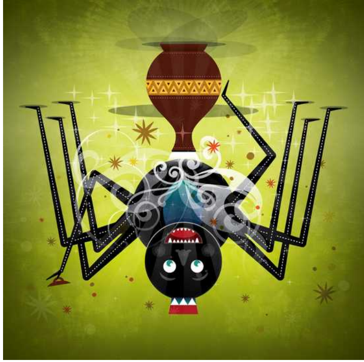
Anansi og visdommen

Ghanaian folktales ✎ Wiehan de Jager 🗣️ dohliam 📖 kinesisk / bokmål 🗣️ nivå 3 📏